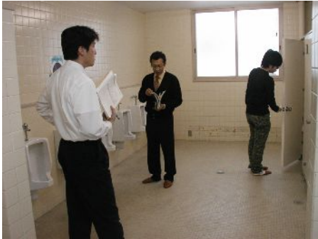
■ワークショップ「五感で体験」