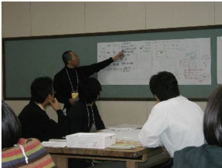
■ワークショップ「五感で体験」発表